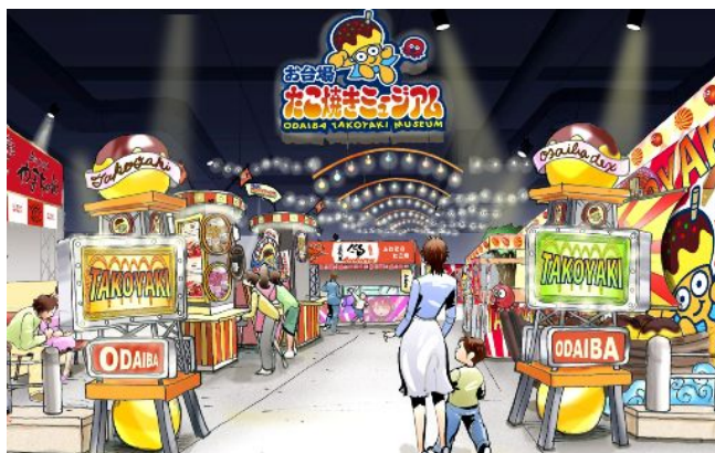
上) 店内イメージパース

831.92㎡のゾーンに、中央に共通の飲食スペース128席を設けます。たこ焼きのルーツがわかる物知りコーナーや大きなたこ焼きオブジェなどもあり、縁日のような雰囲気のなか、たこ焼きの「たこ」「粉」「水」「だし汁」「焼き」「ソース」にこだわった職人が焼き上げたアツアツのたこ焼きをその場でお召しあがりいただけます。