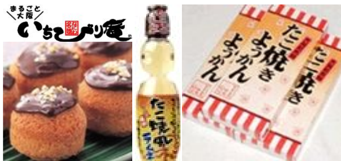
左: たこ焼きマドレーヌ (630 円)

大阪限定のキャラクターグッズや、たこ焼き専用ソースはじめ、大阪の地ソースを多数取り揃えます。