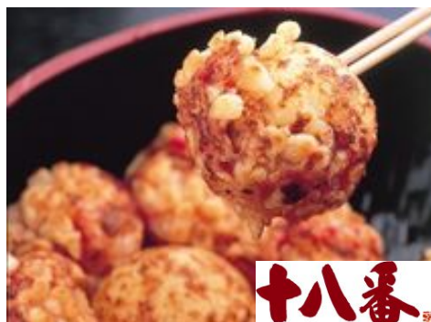
高知県室戸産の深海塩

「たこ焼十八番」のたこ焼きの特徴は、独特のサクサクとした食感、ゴツゴツとした見た目を引き出す、山盛りの天かすです。丸みのある上質な天かすをぎっしり鉄板に引き詰め、天かすが溶けないうちにリズムカルに三度四度と返す焼師の高速技も当店ならではです。