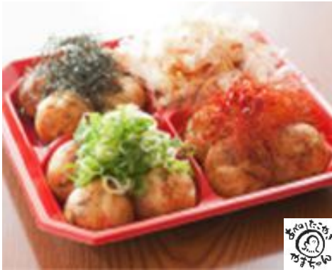
やまちゃんプレミアム