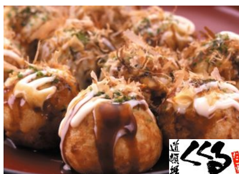
大タコ入りたこ焼

「たこ家 道頓堀 くくる」の直径 5cm のたこ焼きは、旨みたっぷりの大粒タコ、舌触りのよい金山寺ネギ、鹿児島枕崎産の最上級のカツオを使った鰹節など、素材へのこだわりが特徴です。