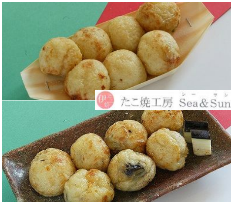
上) “伊たこ焼” 塩ガーリック 下) “ベジたこ” 茄子

「たこ焼工房 Sea & Sun」の特徴は古来からの食文化であるたこ焼きを現代風にアレンジしている点です。オリーブオイルを使ったイタリア風たこ焼き“伊たこ焼”、タコの代わりに新鮮な野菜を入れたベジタブルなたこ焼き“ベジたこ”などを、これまで開発してきました。